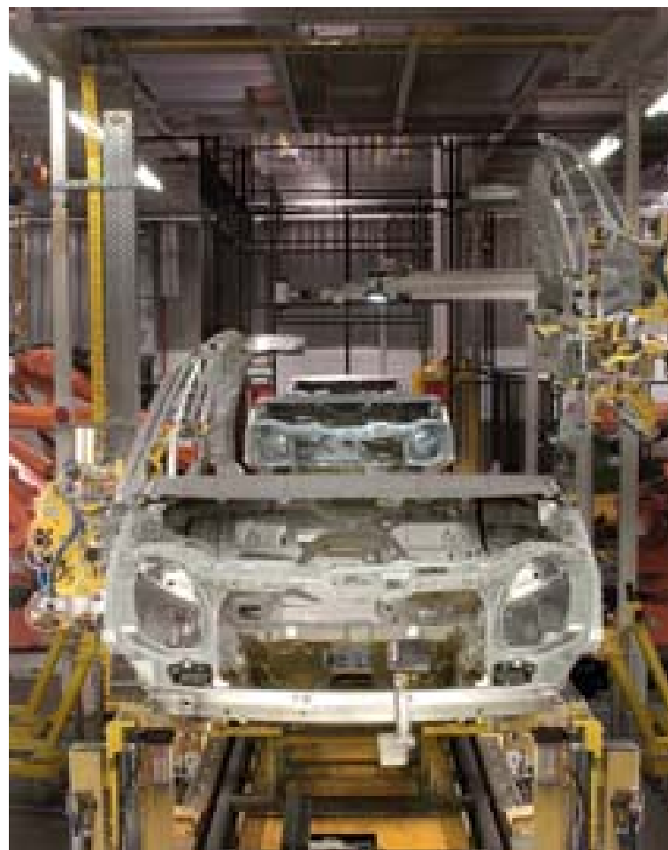
La automoción en Aragón supone entre el 3,5 y el 4 por ciento del PIB. eE

Fuente: Base de datos de comercio exterior de las Cámaras de Comercio y la Agencia Tributaria. (*) De ene-oct (últimos datos disponibles) elEconomista