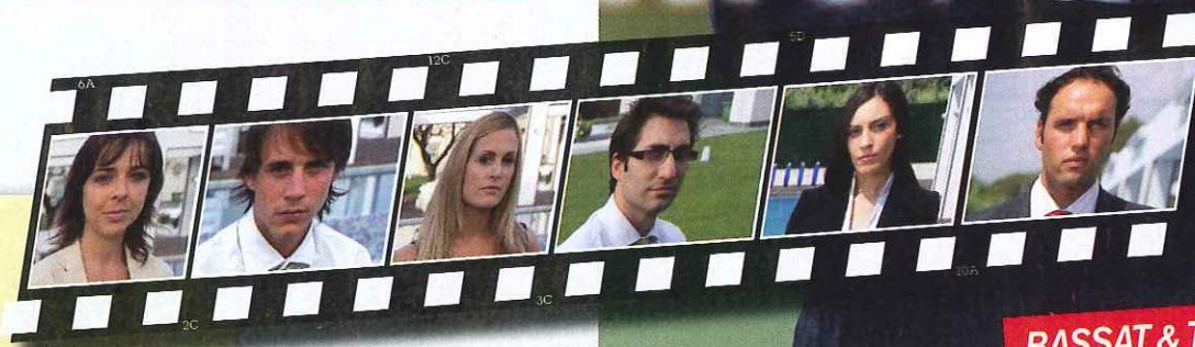
BASSAT & TRUMP