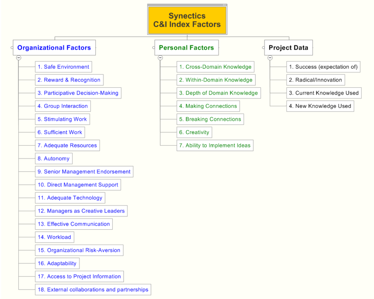
Figura 1 : Factores synectics medidos en el Diagnostico Altran

Para la medida del estado de la organización se siguió el siguiente esquema: