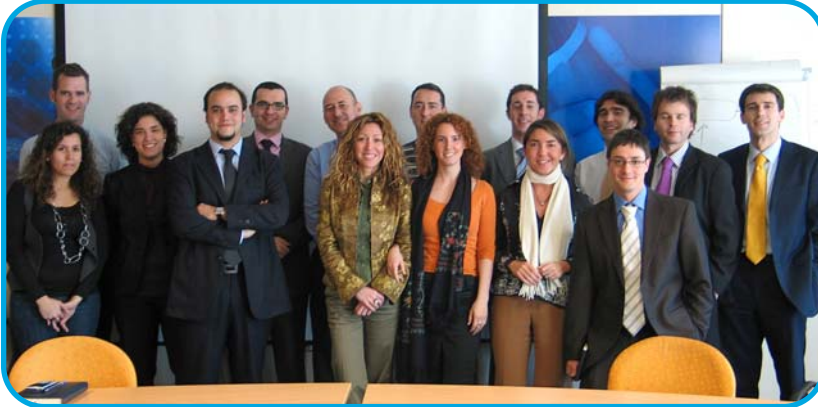
Presentación de resultados del proyecto OMEGA.

Uno de los grandes proyectos que hemos puesto en marcha, por la elevada participación, por su representatividad y por los hitos conseguidos. Se trata de una apuesta de la Dirección de la compañía, que pretende impulsar la utilización de las metodologías más avanzadas en Innovación, tanto a nivel interno como externo. Un proyecto que ha movilizado a más de 60 personas con un reto en común: Co-Crear la empresa que todos queremos.