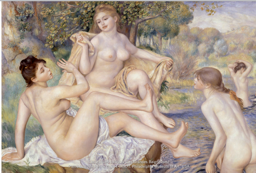
Las grandes bañistas (Les Grandes Baigneuses) Pierre-Auguste Renoir (1884-1887). Philadelphia Museum of Art, USA